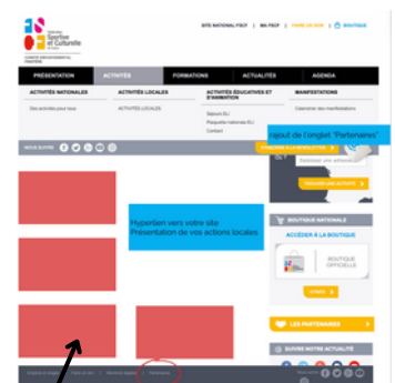
Mockup site internet